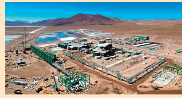
Planta de producción de litio de la minera Arcadium Lithium (adquirida por Rio Tinto) en Catamarca (Livent)

En los 12 meses del 2024 las exportaciones de litio alcanzaron los US$631 millones, una caída del 25,7% interanual. Del total de las ventas externas de la minería, el litio representó el 13,6%. La cifra se explica por el precio, debido a que en el acumulado del año las cantidades exportadas exhibieron un incremento del 54%. El total de exportaciones mineras ascendió a US$4.647 millones.