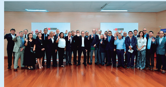
Ministro Salardi con los representantes de los gremios empresariales

Representando a los pequeños y microempresarios estuvieron representantes de la Plataforma Nacional de Gremios Mipymes, Asociación de Gremios de la Pequeña Empresa del Perú, Asociación Empresarial