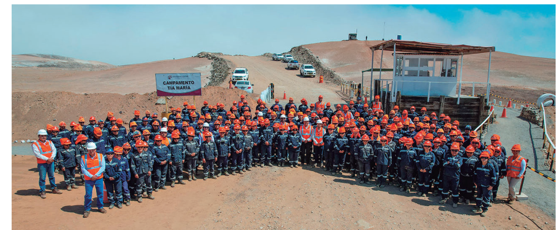
Trabajadores de Tía María

Los Chancas - Apurímac: Este proyecto de crecimiento, ubicado en Apurímac, Perú, es un depósito de pórfido de cobre y molibdeno. La estimación actual de recursos minerales de cobre indicados son 98 millones de toneladas de óxidos con un contenido de cobre de 0.45% y 52 millones de toneladas de sulfuros con un contenido de cobre de 0.59%. El proyecto Los Chancas prevé una mina a tajo abierto con una operación combinada de procesos de concentración y lixiviación para producir 130,000 toneladas de cobre y 7,500 toneladas de molibdeno al año. La inversión de capital estimada es de $2,600 millones y se espera que el proyecto comience a operar en 2031.