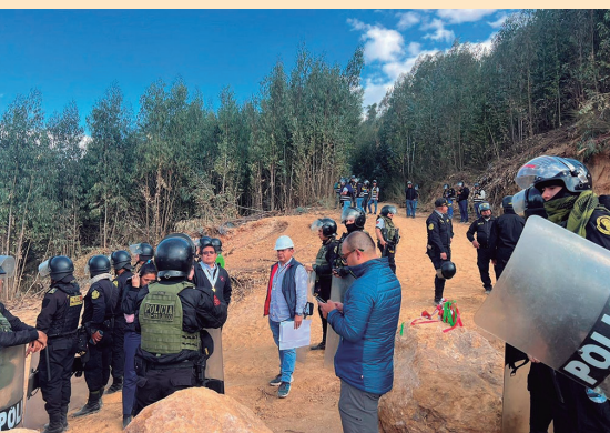
Operativo contra minería ilegal en Huamachuco

Cabe destacar que el alza en el precio del oro genera que diversos grupos ilegales amplíen sus operaciones en la búsqueda de mayores ganancias, convirtiendo a Huamachuco en un foco de minería ilegal que propicia también una serie de elementos delictivos en torno a esta actividad.