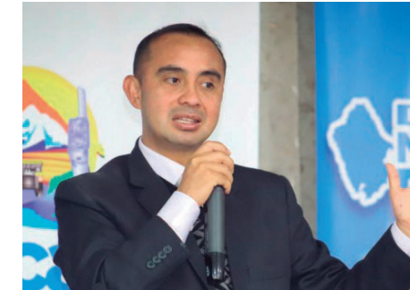
Koki Noriega, gobernador de Áncash

Koki Noriega invocó a que se haga más ágil el proceso para ejecutar obras de inversión pública.