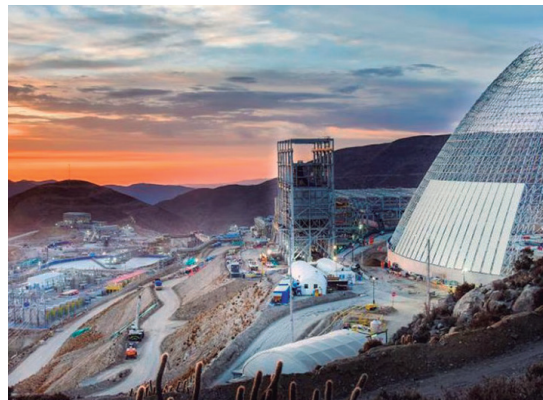
Mina Quellaveco: recién este año ha alcanzado su nivel máximo de producción

Definitivamente que en el Perú necesitamos una ley para la minería artesanal y para la pequeña minería ya formalizada, porque en la Ley General de Minería que se dio en los 90 solamente se contemplaba el estrato de pequeña minería y se contemplaba el estrato del régimen general donde está la mediana y gran minería, pero no se contempló el estrato de minería artesanal. Esto recién se hizo entre el 2001 y 2002 cuando se aprobó una ley de promoción para la minería artesanal y la pequeña minería, con resultados favorables porque fue producto de un diálogo entre mineros, entre entidades y finalmente se aprobó el estrato de la minería artesanal. También se aprobaron muchos otros temas. Por ejemplo, se aprobaron los acuerdos entre mineros que tenían concesiones con mineros artesanales que no tenían concesiones y eso fue importante porque muchas empresas como Poderosa llegaron a acuerdos con mineros de la zona y estos acuerdos se inscribían en Registros Públicos y se han desarrollado de manera satisfactoria y no solamente con Poderosa, sino también con otras empresas del sur del país. Esta ley lamentablemente quedó trunca, porque en el 2002 se dio una ley de regionalización y las competencias de la recién creada minería artesanal y de la pequeña minería fueron transferidas a los gobiernos regionales a través de las direcciones regionales