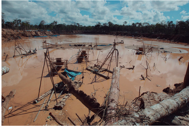
Acabar con la informalidad en la minería es una meta del Minem

Digamos que la Ventanilla Única Digital tiene tres etapas. Una primera etapa encabezada por la Presidencia del Consejo de Ministros, nos reunimos diez entidades públicas para elaborar una página web, la que en este momento ya ha sido creada. En ella un solo usuario puede acceder directamente a ver todos los permisos que se requieren para la actividad de exploración, explotación y beneficio, así como para las ampliaciones, para explotación y beneficio. Eso ya está concluido. Nos demoró un promedio de 3 a 4 meses. En el plazo que se había comprometido el gobierno se logró. En este momento ese link de la Ventanilla Única Digital se puede ubicar en el Ministerio de Energía y Minas.