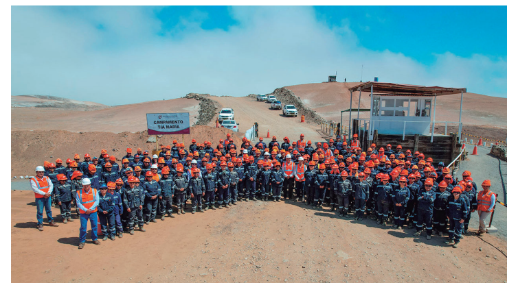
La reactivación de Tía María impulsara nuevas inversiones en minería

la exploración es una actividad de investigación, donde todavía no se van a extraer recursos minerales y una vez que tengamos proyectos en exploración que pasen a la fase de explotación, también que nos apoyen para poder desarrollarlos, para que se construyan estos proyectos.