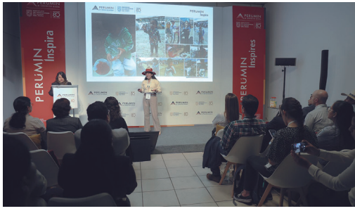
PERUMIN Inspira: Once ideas pasaron a la gran final y competirán por valiosos premios

Este año, PERUMIN Inspira presentó una nueva edición orientada a impulsar las ideas innovadoras de estudiantes de institutos y universidades, para que desarrollen emprendimientos con impacto social en la sierra y la selva del Perú.