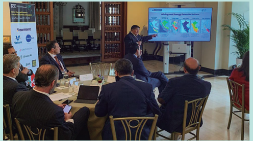
Ministro Mucho durante su exposición en Estados Unidos

“En cuanto a exploración minera, existen en este momento 75 proyectos ubicados