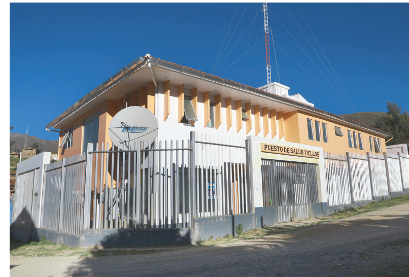
Hospital que será financiado por Antamina mediante el sistema Obras por Impuestos

De los 6 índices que forman parte de este pilar en cinco ocupa el último puesto, estos son: Nivel de ingresos por trabajo, Empleo adecuado, Fuerza laboral educada, Empleo informal y Creación de ingresos por trabajo. En este panorama desolador, solo en Brecha de género en ingresos por trabajos, Cajamarca no ocupa el puesto 25°, entre los índices de este pilar, sino el 20°.