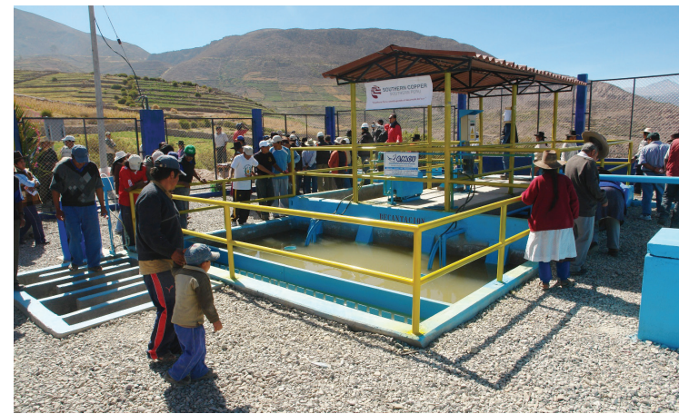
Planta de agua de Quilahuani inaugurada por Southern en el 2010

En Cobertura de personal médico Arequipa está en la primera posición, antecediendo a Lima. Tacna está 3°, Ica 5° y Moquegua 9°.