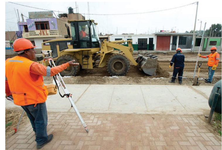
Antamina ha contribuido a la construcción de pistas y veredas en Huaramey

Junín ocupa el puesto 17° en este pilar en el país y el 4° de la sierra. Su mejor índice los tiene en Vacunación con el puesto 6°,