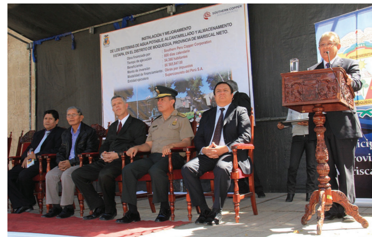
Southern ha financiado la instalación y mejoramiento de los sistemas de agua potable, alcantarillado y almacenamiento en Moquegua

También está bien clasificada en Continuidad de la provisión de agua 7° lugar, Red vial local pavimentada o afirmada 8° y Acceso a electricidad, agua y desagüe 9°. En Acceso a telefonía e internet móvil el 17°, mientras que en Precio de la electricidad y Acceso a internet fijo ocupa el 18°.