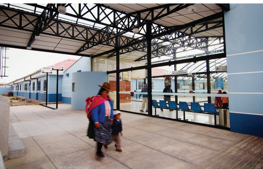
Hospital de Espinar que fue financiado por Minera Tintaya.