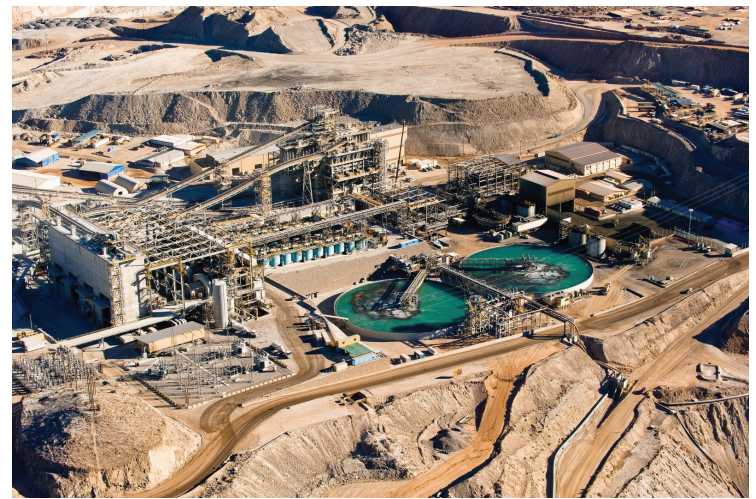
La producción cuprífera de la mina Cerro Verde contribuye a que Arequipa tenga el 2° PBI Real y el 2° PBI real per cápita del Perú.

La Fundición y Refinería de Ilo contribuyen a que Moquegua tenga el PBI real per cápita más elevado del Perú