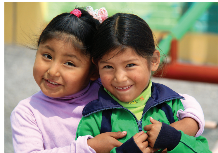
Los niños del área de influencia de las mineras no padecen desnutrición

Cajamarca es uno de los seis departamentos que ha descendido su población entre los dos últimos censos, el de 2007 y el de 2017 (3.4%), lo que se explica por la reducción de la producción minera