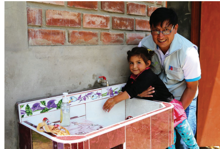
El proyecto "Las Bambas" ha posibilitado la "Continuidad de la provisión de agua" en Chalhuanhuacho

Los índices de Moquegua en este pilar, están entre los mejores en: Acceso a telefonía e internet móvil 1° lugar, Red vial local pavimentada o afirmada 2°, Acceso a electricidad agua y desagüe 4° y Acceso a Internet fijo 5°. Con 19.5 horas al día su 9° ubicación en Continuidad en la provisión de agua no está mal, por estar este departamento en una zona de escasez de lluvias. Los índices de este pilar en que Moquegua está mal son: el Precio de la electricidad en que está en la 17° ubicación y en Densidad del transporte aéreo nacional en que ocupa el puesto 22°, lo que se puede explicar por su proximidad a Tacna, lo que le permite utilizar a sus residentes los servicios aéreos de esa región.