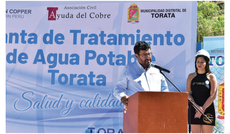
A través de la asociación civil Ayuda del Cobre, Southern ha contribuido a dotar de agua potable a los distritos de su área de influencia

Madre de Dios, ocupa el puesto 12° en este pilar, con su mejor calificación en el índice de Desnutrición crónica de la población infantil con el puesto 7°. En los demás índices Madre de Dios tiene posiciones aceptables: Partos institucionales 10°, Cobertura de personal médico 11°, Esperanza de vida al nacer y Vacunación 13°. Su peor calificación la tiene con la Prevalencia de anemia con el puesto 19°.