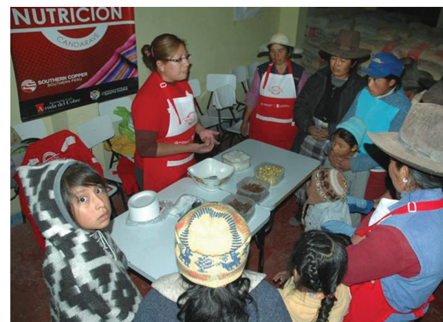
La mayoría de las grandes empresas mineras tienen programas de nutrición infantil

Madre de Dios, 5° lugar en el pilar laboral, es uno de los departamentos donde con el 7° lugar la Brecha de género es menor. Su único índice que no es bueno es el de Creación de empleo formal donde se ubica en el puesto 15°. Todos los demás son buenos o aceptables: 3° en Empleo adecuado, 4° en