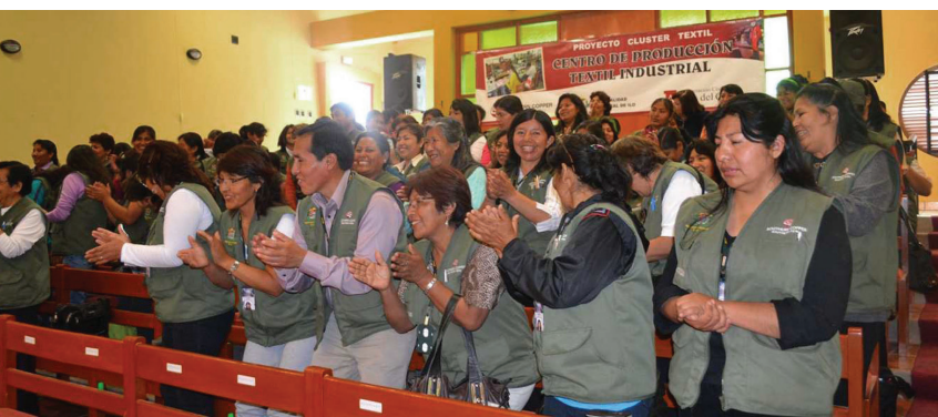
Proyecto de Centro de Producción Textil Industrial de Southern. La minería contribuye a incrementar la producción en otros sectores.