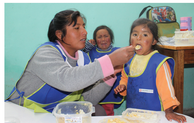
Las mineras del sur combaten la desnutrición infantil. En Tacna es de solo 0.7%, Moquegua 1.4%, Lima 2.8%, Ica 3.6% y Arequipa 3.8%

A la inversa de lo que ocurre en Ancash, Junín una región que tuvo una gran influencia minera en el siglo pasado, la que se ha reducido sustancialmente en los últimos años, se ubica en el pilar