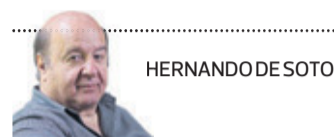
HERNANDO DE SOTO

Uno de los economistas peruanos más influyentes narra cómo la lucha del campesinado contra Sendero Luminoso se vincula íntimamente al surgimiento de los sectores capitalistas emergentes.