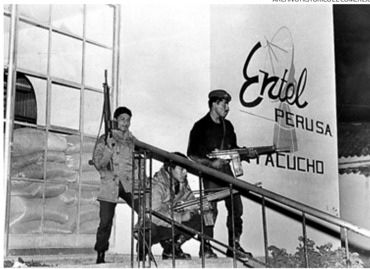
TERRORISMO. Voladura de estación de alta tensión de Entel Perú.