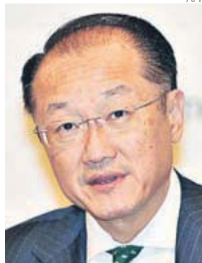
Jim Yong Kim, Jefe del BM.

El presidente del BM, Jim Yong Kim, señala que todavía hay muchos latinoamericanos que están en riesgo de